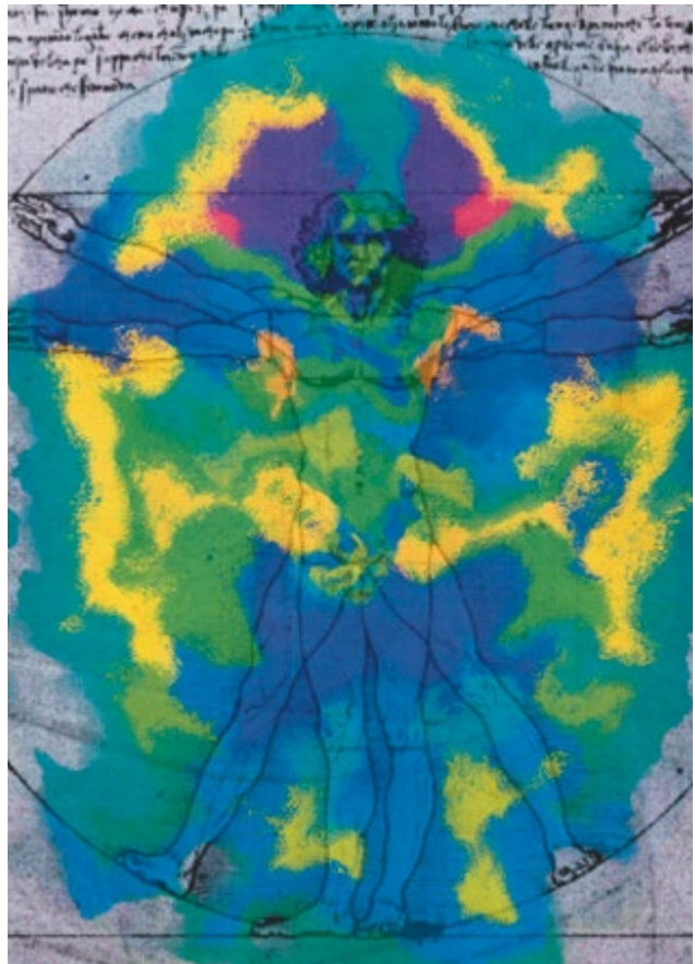
Aurafoto 10 Minuten nach der „Behandlung“ mit Rosa Sehnsucht

Der dunklere magentafarbige Anteil sowie das helle Violett im Kopfbereich stehen für künstlerische Begabungen, Sensitivität, weibliche Kreativität, Intuition, bedingungs-